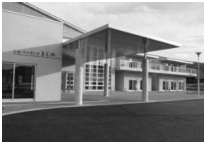
今年度開所した「シルバーランドきしの」