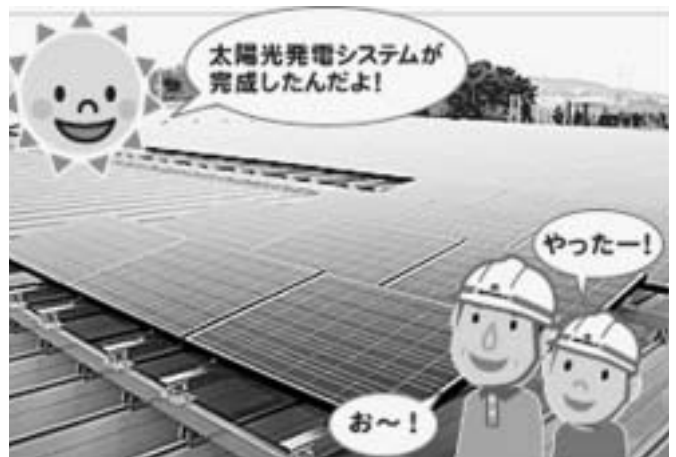
LLP「佐久咲くひまわり」1メガソーラー事業