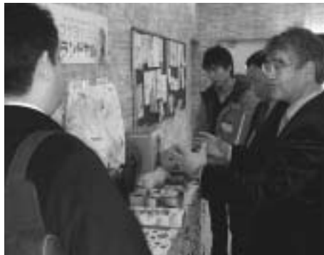
佐久市物産の中国販売市場調査中（於：上海）