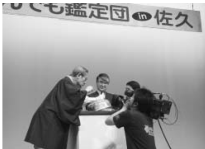
「なんでも鑑定団 in 佐久」出演 佐久市の知名度アップに一役