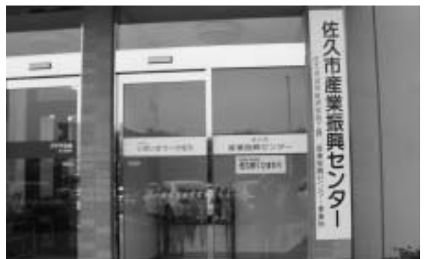
平成18年度に産業活性化のため設置した「佐久市産業振興センター」