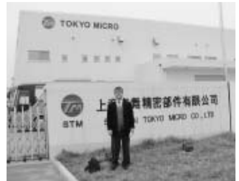
佐久市に本社がある東京マイクロ上海工場視察（社員1200人）