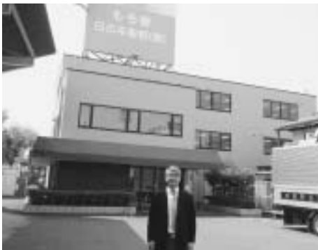
米粉製粉会社（日の本穀粉株式会社）を視察（栃木県）