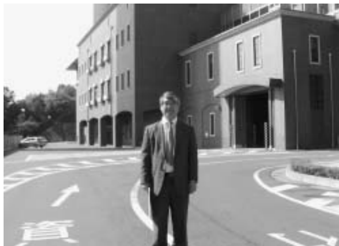
＜中農地域広域行政事務組合視察＞

⇒東御市・軽井沢町・立科町・佐久市（旧望月町・旧浅科村）で運営され「やむなく家庭での生活が困難な比較的健康なお年寄り」を入所対象にした老人ホーム