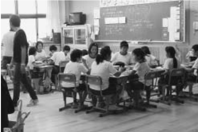
＜今年4月4校統合し開校した望月小学校視察＞ 廊下に境の無いオープン教室として注目されている。

現在、総務文教委員会副委員長、総合文化会館建設特別委員として活動しています。総務文教委員会は総務部、企画部、教育委員会と市の中枢を担う部署です。総合文化会館建設特別委員会は重要な時期をむかえておりますので、委員数は前期より増員となっています。委員会では委員会付託審査、条例審査や視察など幅広い活動をしています。