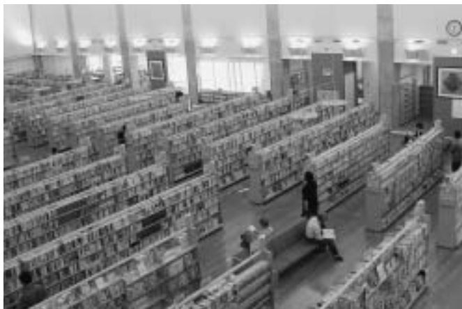
＜佐賀県諫早市立図書館視察＞ 合併効果を見据え中央図書館を基点に各地域図書館8館をネットワーク化し活用を推進