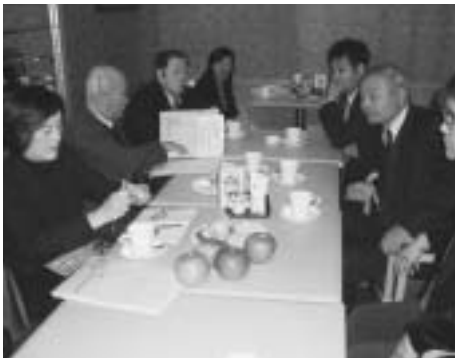
佐久市の「りんご」の中国販売の可能性について中国人バイヤーと打合せ（於：上海空港）