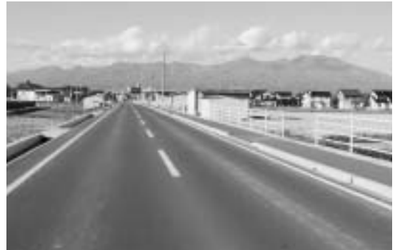
改装整備が進む鍛冶屋(高柳)～原線