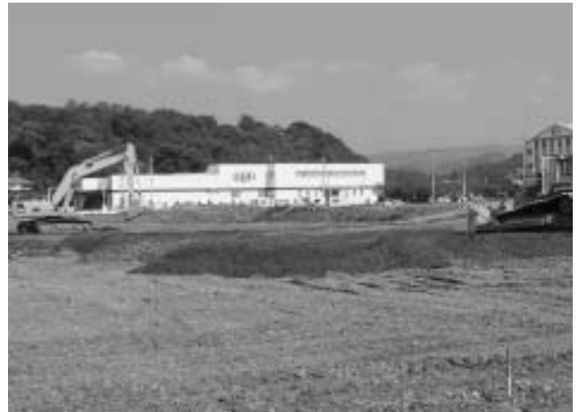
離山南工業団地造成中（平成20年10月）