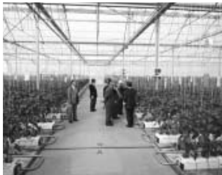
近代的なハウス農場（茨城県）（株式会社Tedy）を視察