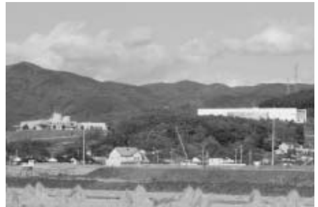
高台に佐久リサーチパークを望む 300人の雇用が生まれる