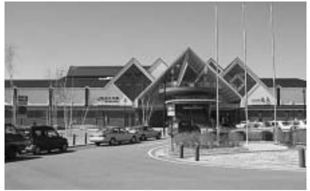
平成26年北陸新幹線（長野～金沢）開通により 今後も利用客数増加が見込める〈佐久平駅〉