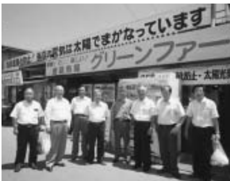
産直市場「グリーンファーム」視察（伊那市）全国有数の産直市場を展開