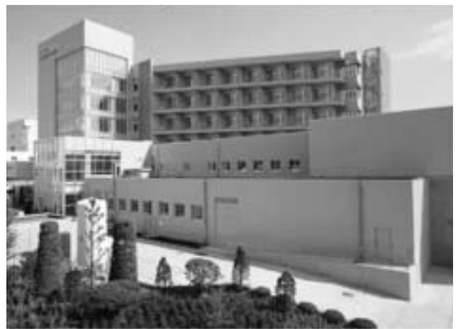
新装なった浅間総合病院は佐久市の中核病院としての役割はますます高まる