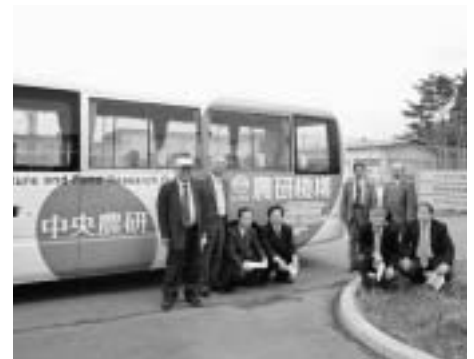
つくば研究学園都市にある「農研機構」視察（茨城県）