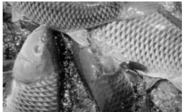
地域団体商標に登録されたブランド「佐久鯉」