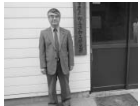
北海道網走市農産物高次加工研究所視察