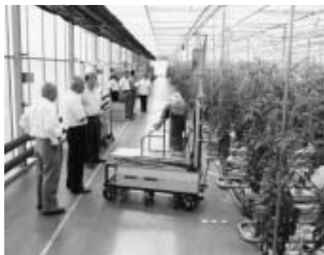
GOKOアグリファクトリ(株)のトマト生産施設視察（上伊那郡中川村）