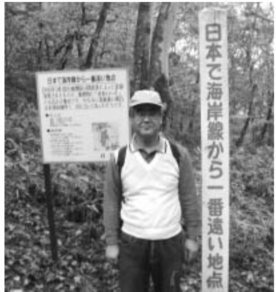
日本で海岸線から一番遠い地点」到達 国土地理院認定 佐久市田口字榊山（標高 1200メートル田口峠から1時間弱）佐久市 観光協会から『到達認定書』が頂けます。