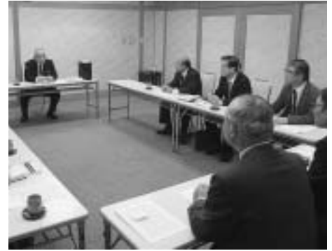
市長を招き地域医療の勉強会