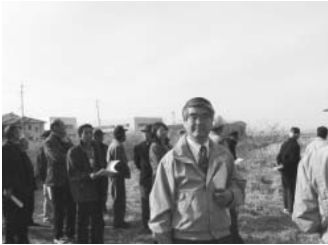
千曲川水系河川整備促進期成同盟会 野沢橋上流 野沢原区無提地域視察

長野県東京事務所にも単身伺い東京事務所長他企業誘致担当者と佐久市の現況と今後の誘致について話し合いを持ったり、野沢南高校改革プラン（多部制・単位制への転換）にも積極的に関わってきました。又、地域活動にも積極的に参加しています。活動の一端をご紹介します。