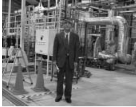
バイオマス実験施設視察（信濃町） 稲や稲ワラからエタノールを抽出