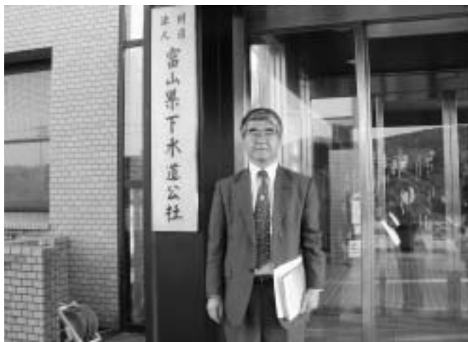
＜富山県下水道公社視察＞