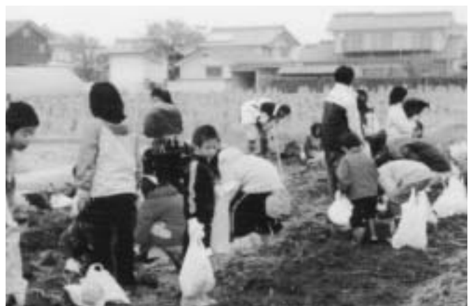
鍛冶屋区青少年育成会 野菜作り体験学習（芋掘り中）この後の楽しみは 「焼芋大会」