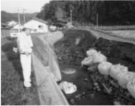
台風9号の被害状況視察 内山の被害が甚大