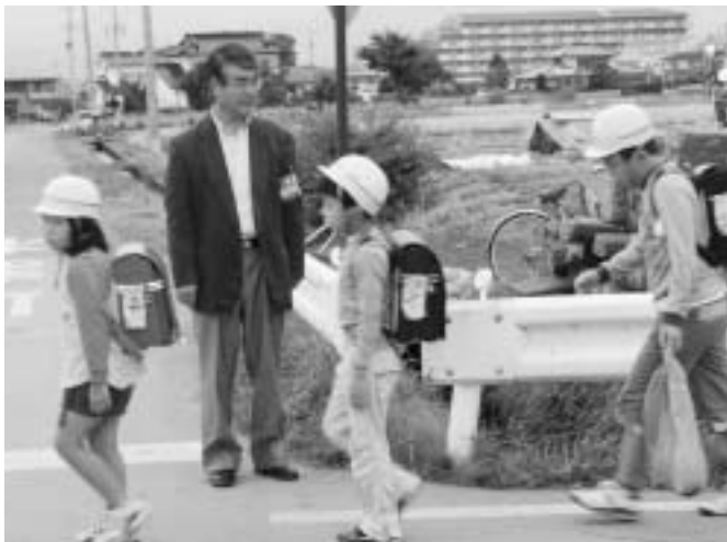
鍛冶屋区青少年育成会 「あいさつ運動強化週間」実施中