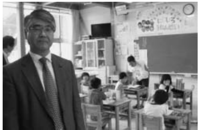
＜佐賀市立北山校視察＞ 小中一貫校として開校。特に少子化の時代には非常に有効な教育施策