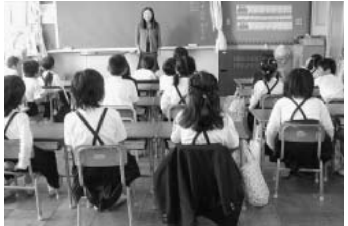
＜山口県山陽小野田市立須恵小学校視察＞ 特区制度を活用し百マス計算等を用いた「生活改善・学力向上プロジェクト」の取り組みで実績を出している。