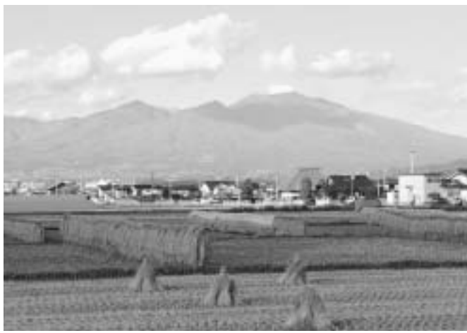
佐久平の田園から浅間山を望む

佐久市は昨年経済産業省の「企業立地に頑張る市町村20選」に選ばれた理由も、児童館はじめ子育て支援が上げ